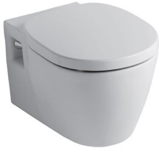
Ideal Standard Wandcloset, diepspoel met duroplast zitting en deksel met RVS scharnieren, wit