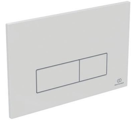
Ideal Standard Bedieningspaneel Oleas M2 wit