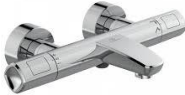
Ideal Standard Bad/douche thermostaat Cool Body in chroom