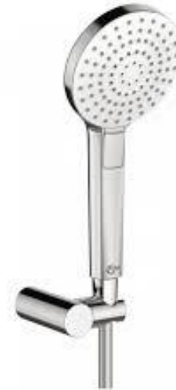
Ideal Standard Handdouche rond met 3 functies en doucheslang